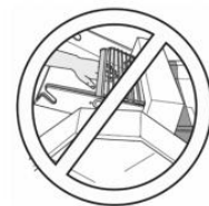
CUIDADO Risco de Esmagamento de Mãos.

Para identificar os riscos decorrentes de tensões perigosas.