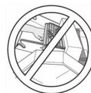
CUIDADO Risco de Esmagamento de Mãos.

Para identificar os riscos decorrentes de tensões perigosas.