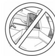
CUIDADO Risco de Esmagamento de Mãos.