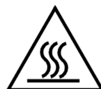
Superfície Quente IEC 60417-5041

Para identificar os riscos decorrentes de tensões perigosas.