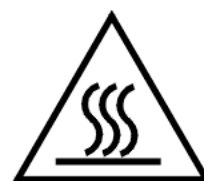
Superfície Quente IEC 60417-5041

Para identificar os riscos decorrentes de tensões perigosas