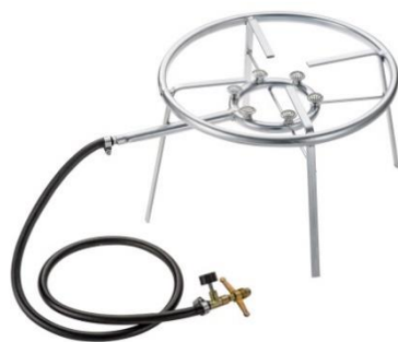
Fogareiro a Gás com 6 Caulins

Para aquecer/derreter o chocolate e demais ingredientes que são adicionados para os preparos de doces e salgados. Pode ser utilizado um fogareiro a gás de 6 caulins, conforme figura abaixo. A altura da chama com o fundo da panela é conforme projeto do fogareiro, aproximadamente 40,00 mm. Para um melhor preparo, recomendamos utilização da chama baixa do fogareiro, com isso a mistura dos ingredientes fica mais homogênea e reduz o risco de queima dos ingredientes.